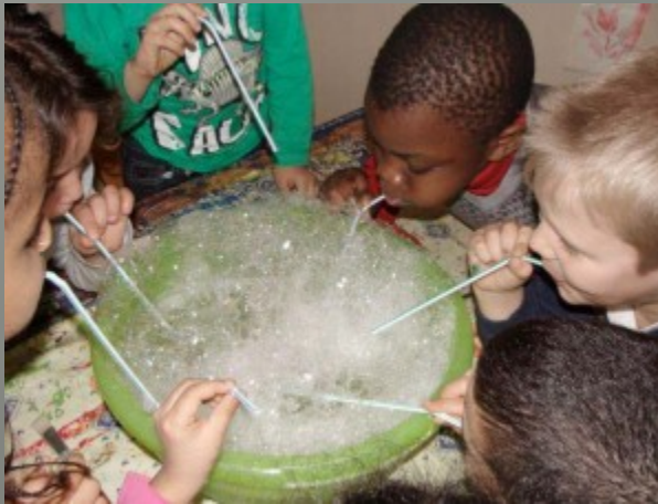
Les jeux d'exploration