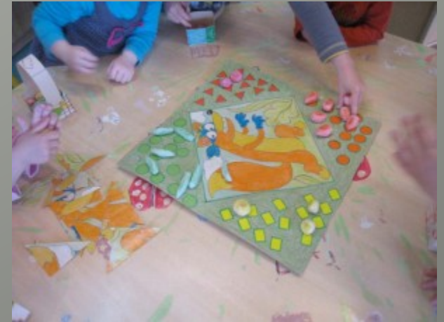
Les jeux à règles