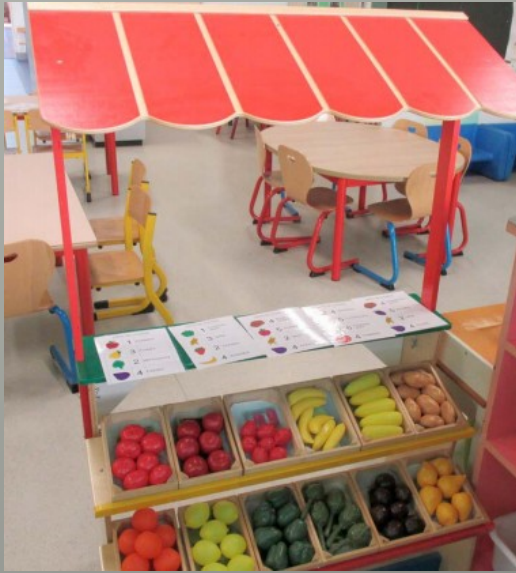
Les jeux symboliques