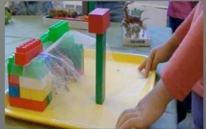
Les jeux de construction